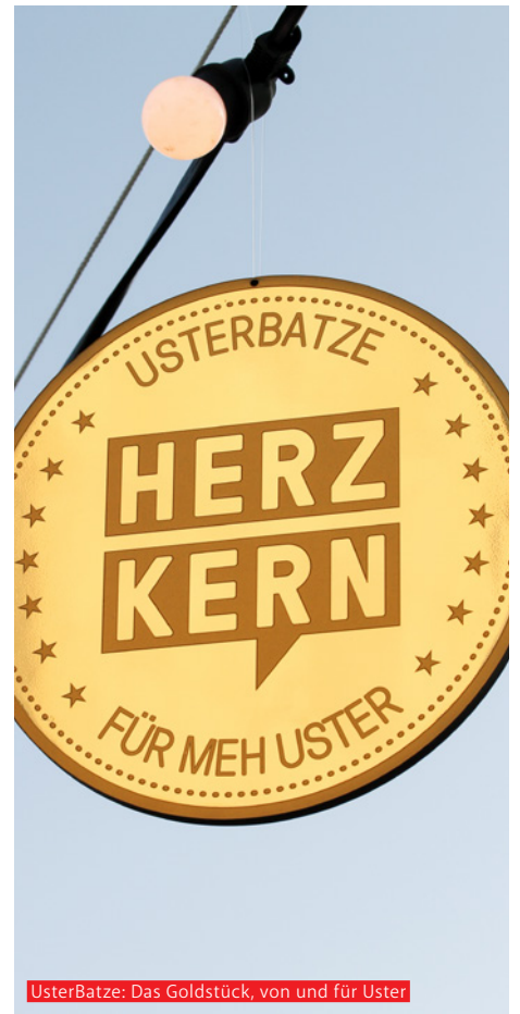
UsterBatze: Das Goldstück, von und für Uster