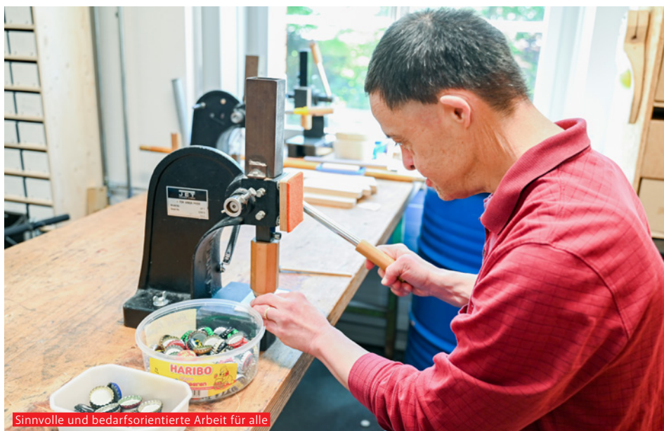
Sinnvolle und bedarfsorientierte Arbeit für alle

Mitten in Uster liegt der Wagerenhof (liebevoll Wagi genannt). Ein Ort, der für Menschen mit Beeinträchtigung ein Zuhause sowie Arbeitsort ist. Das vielfältige und bedarfsorientierte Angebot wird laufend weiterentwickelt. Zugunsten der Lebensqualität, nah am Menschen, nah am Leben.