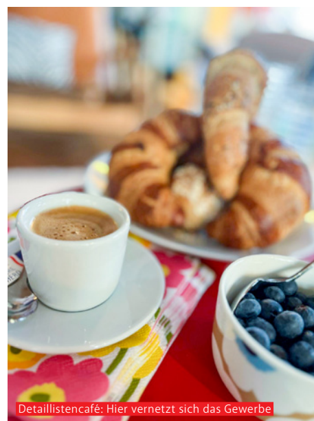
Detailistencafé: Hier vernetzt sich das Gewerbe

tet HERZKERN dabei seit Beginn als wichtiger Partner.