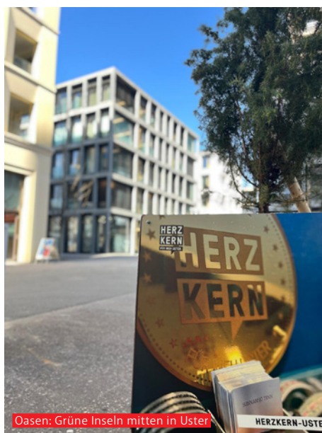
Oasen: Grüne Inseln mitten in Uster