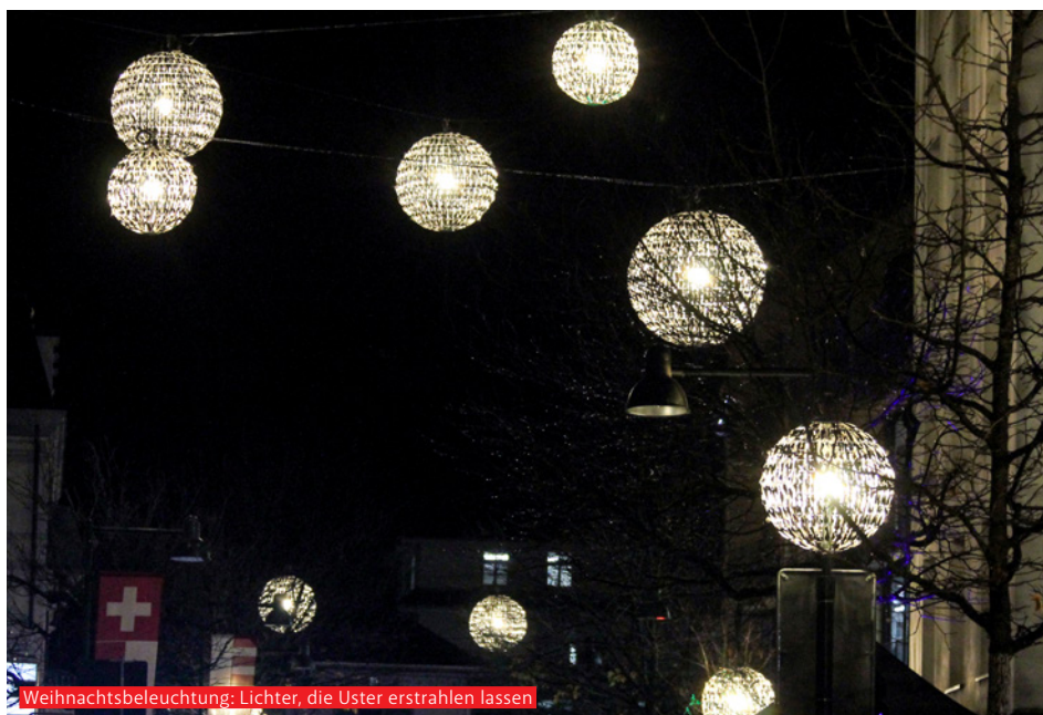
Weihnachtsbeleuchtung: Lichter, die Uster erstrahlen lassen

Solche Projekte entstehen nicht zufällig. Sie entstehen durch Menschen und Organisationen, die Verantwortung für ihre Stadt übernehmen. Das Wirtschaftsforum Uster beglei-