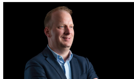
CLAUDE GIGER PROJEKTE UND KOMMUNIKATION