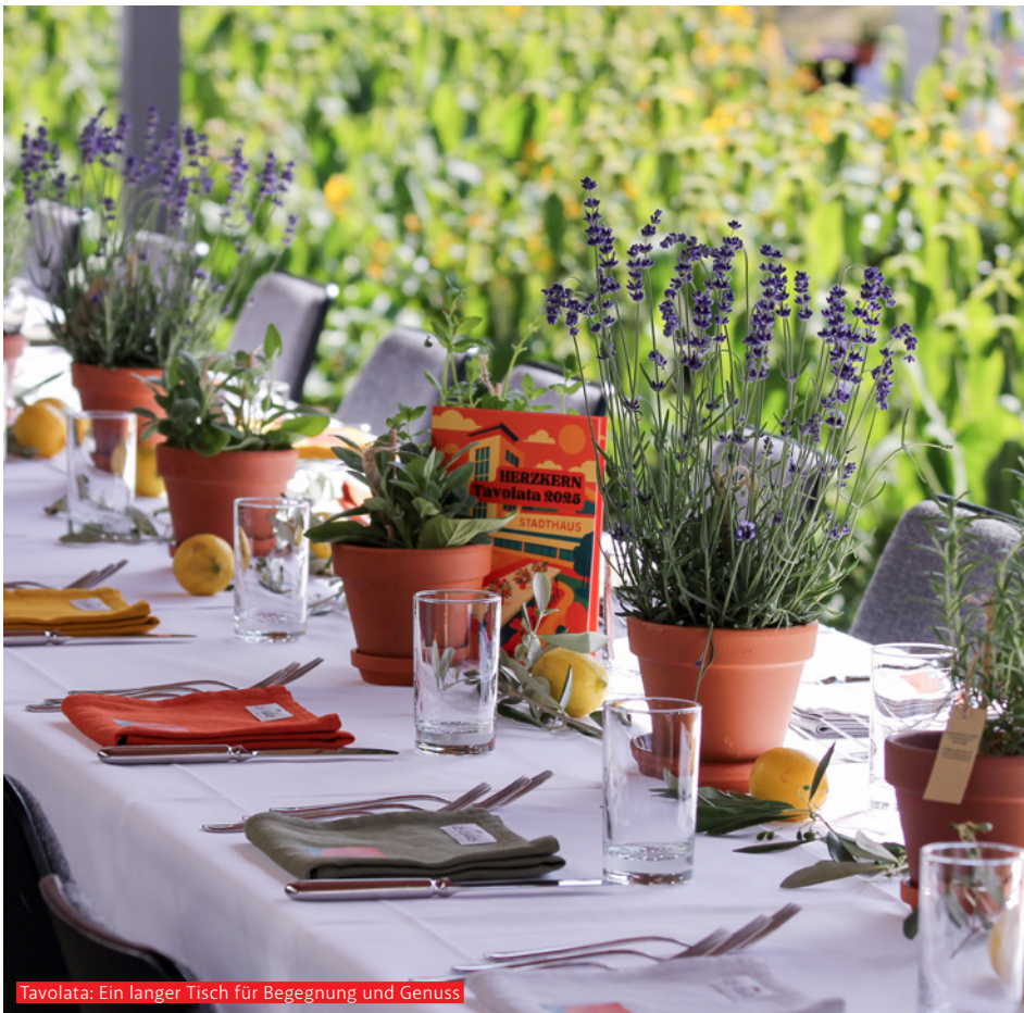
Tavolata: Ein langer Tisch für Begegnung und Genuss